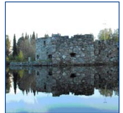
Kierrosten aikana tutustumme myös Kajaanin linnanraunioiden historiaan.

Kultaisen 60-luvun kierros Kajaanissa. Kierroksella palautamme mieleen, miltä kaupunki näytti ja mikä kaupunkilaisia puhutti 60-luvulla. Tutustumme myös nykyhetken nähtävyyksiin ja asioihin.