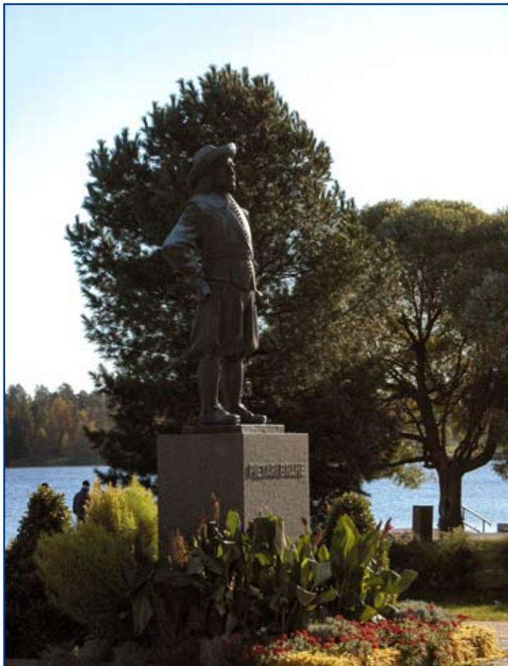
Kajaanin kaupungin perustaja, kreivi Pietari Brahe

Ammattitaitoisia, auktorisoituja oppaita voi varata kiertoajeluille tai kävelykierroksille myös muuna aikana Kajaani Infosta. Opastamme suomen, ruotsin, saksan, englannin, ranskan, unkarin ja venäjän kielellä.