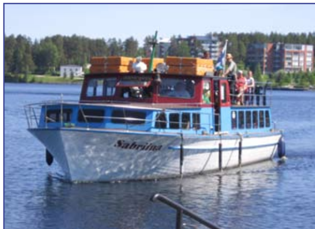
Kauppatorin rannasta lähtevät suosittu risteilyt Kajaaninjoelle.