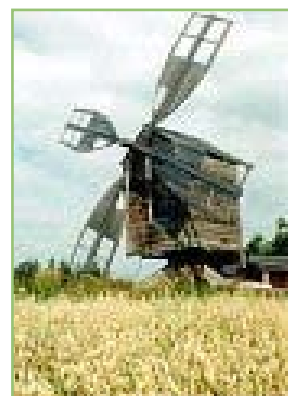
Vuolijoki liitettiin Kajaaniin vuoden 2007 alusta. Teemme retkiä myös Vuolijoelle tilauksesta. Kuvissa vasemmalla Vuolijoen harmaa kirkko sekä tuulimylly, joka on yksi Riihipihan museoalueen rakennuksista.

Yhdistys järjestää myös suosittuja retkipäiviä, päivän retkelle on varattava aikaa 3-5 tuntia. Ryhmän omat toiveet ovat aina retken sisällön lähtökohtana, ota siis meihin yhteyttä, niin laadimme juuri sinulle sopivan retken!