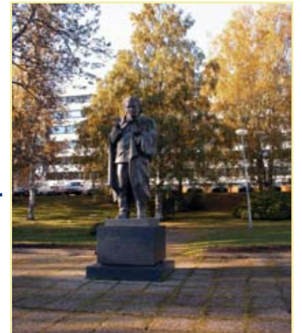
Runoruhtinas Eino Leinon muistomerkki sijaitsee Rantapuistossa.

Harvinainen tilaisuus tutustua Eino Leinon synnyinmaisemiin. Käymme myös Paltaniemen Kuvakirkossa sekä Eino Leino -talossa. Liput kierrokselle etukäteen Kajaani Infosta.