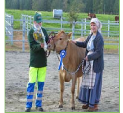
Seppälän koulutilan länsisuomenkarjaa oleva hieho.

Seppälän koulutila ja puutarha. Seppälässä tutustumme maalaiselämään, uuteen suomenkarjaan, kyyttöihin sekä hevosiin. Käymme myös puutarhalla, jossa voi tehdä ostoksia.